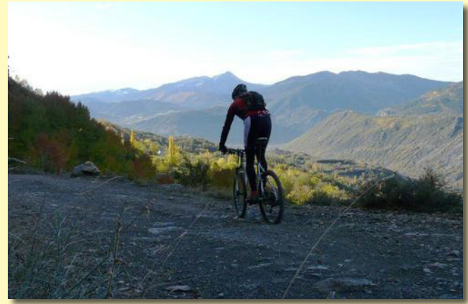
Perfil de la BTT

En realidad se trata de 3 tracks que discurren por idéntico inicio y fin, solamente se diferencian en sus bajadas por que cada una de ellas son una trialera diferente. Todas ellas una gozada de disfrute por sendas estrechas, sin peligro pero técnicas, que discurren por zonas de bosques preciosos. Ir con cuidado pues puede haber paseantes.