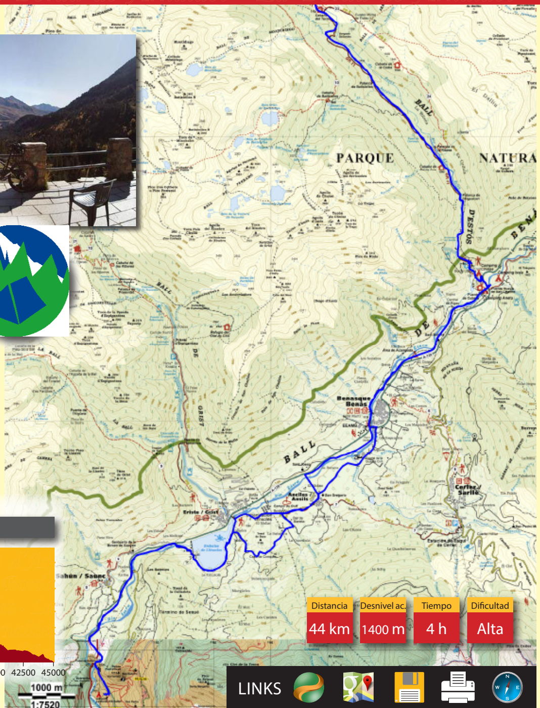
Perfil de la BTT